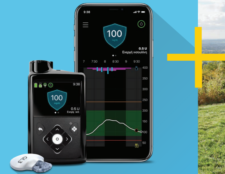
Σύστημα Minimed™ 780G

*Οι εμπορικές ονομασίες τρίτων είναι εμπορικά σήματα των αντίστοιχων δικαιούχων τους. Όλες οι άλλες εμπορικές ονομασίες είναι εμπορικά σήματα κάποιας εταιρείας της Medtronic.